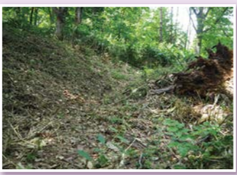
◀戊辰戦争時の塹壕跡地