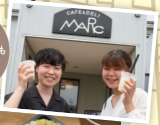
美容と健康を考えたスムージーもおいしい!