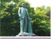
▲安積疎水の計画に尽力したファン・ドールンの銅像

十六橋は猪苗代湖から流れ出る日橋川に架かる石橋で、戊辰戦争の激戦地となった場所です。現在の橋は、近代化産業遺産群に認定されており、平成28年には『未来を拓いた「一本の水路」』の構成施設の一つとして日本遺産にも認定されています。