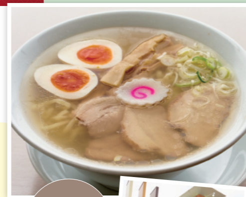
国道49号線沿にあり店内からの眺めも抜群!

会津若松市河東町倉橋字17-1 ☎0242-75-5855 🕒11:00~17:00 📅毎週火曜(祝日は営業)