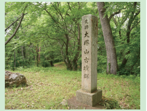
▲標高270mの墓地公園の頂上にあります