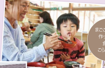
まごころ込めて作った料理 食べにこらんよ~