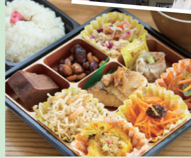
▲アラカルト弁当「雅」