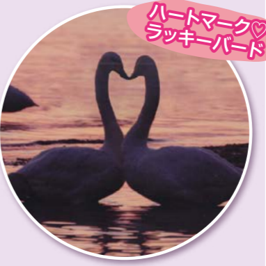
ハートマーク♡ラッキーバード