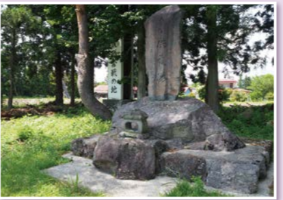
▲戸ノ口原古戦場跡

会津若松市湊町大字赤井笹山原 会津若松観光ビューロー ☎0242-23-8000