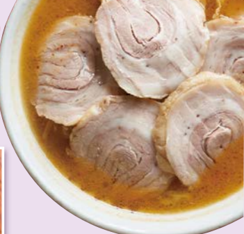
▲チャーシューメン

会津若松市湊町大字共和字清水下1 ☎0242-94-2246 ☎11:00~15:00 ☎金曜日