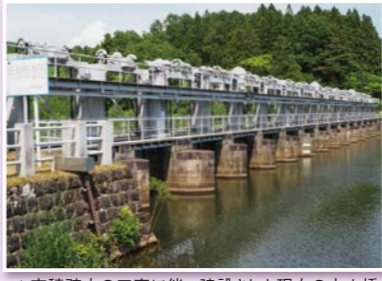
▲安積疎水の工事に伴い建設された現在の十六橋

猪苗代町と郡山市に隣接し、猪苗代湖畔に位置する湊町は、会津地方で磐梯山と猪苗代湖が一望できる自然豊かな町です。またこの町は、豊臣秀吉が通った北限の地といわれ、戊辰戦争では白虎隊士も戦った戸ノ口原が、あ歴史的にも興味深い地域です。