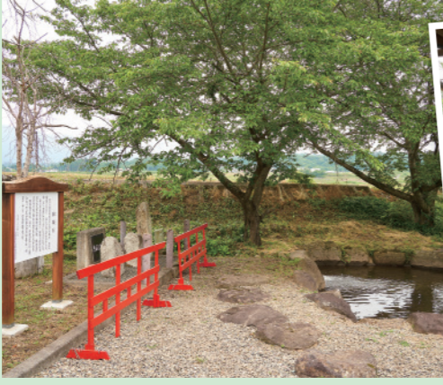
▲姫が身を投じたと言われる池もわずかに残っています