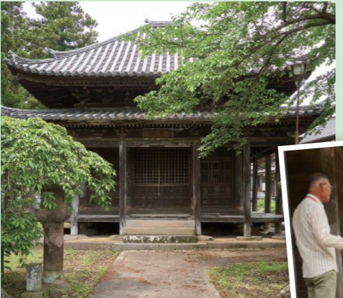
▲豪雪に耐えられるよう四方各6本、太い円柱が建てられています