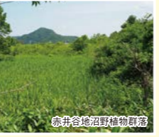
赤井谷地沼野植物群落