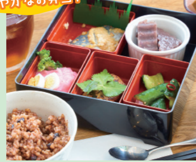
▲日替わりランチの一例「酵素玄米健康美人膳」

会津若松市一箕町大字亀賀川西39-4 ☎0242-36-7710 🕒11:00~16:00/ランチ11:00~15:00(L.O. 15:00) 📅日曜日 ※年末年始休み 📍20台