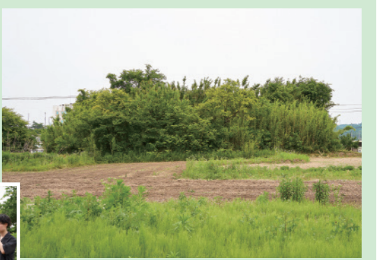
▲実はこの森、前方後円墳なんです!