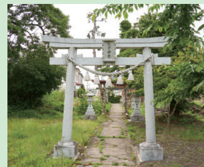
▲猪苗代町や会津若松市湊町にも天子神社があります。