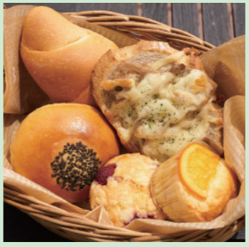
▲国産小麦を使ったからだにやさしいパンの盛り合わせ

会津若松市一箕町大字亀賀字北柳原52 ☎0242-93-7566 🕒10:00~17:00 📅日曜日 📍8台