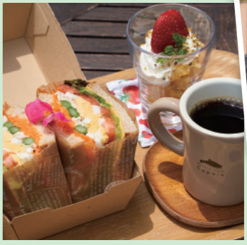
▲ライ麦パンのカラフルサンド(期間限定メニュー。写真は6月現在のカラフルサンド季節で色々なボリュームサンドを提供している)