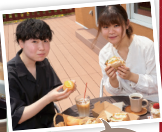
おいしいパンに囲まれて最高に幸せ~!