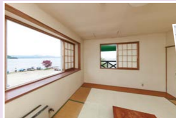
▲客室からは猪苗代湖が一望できます!